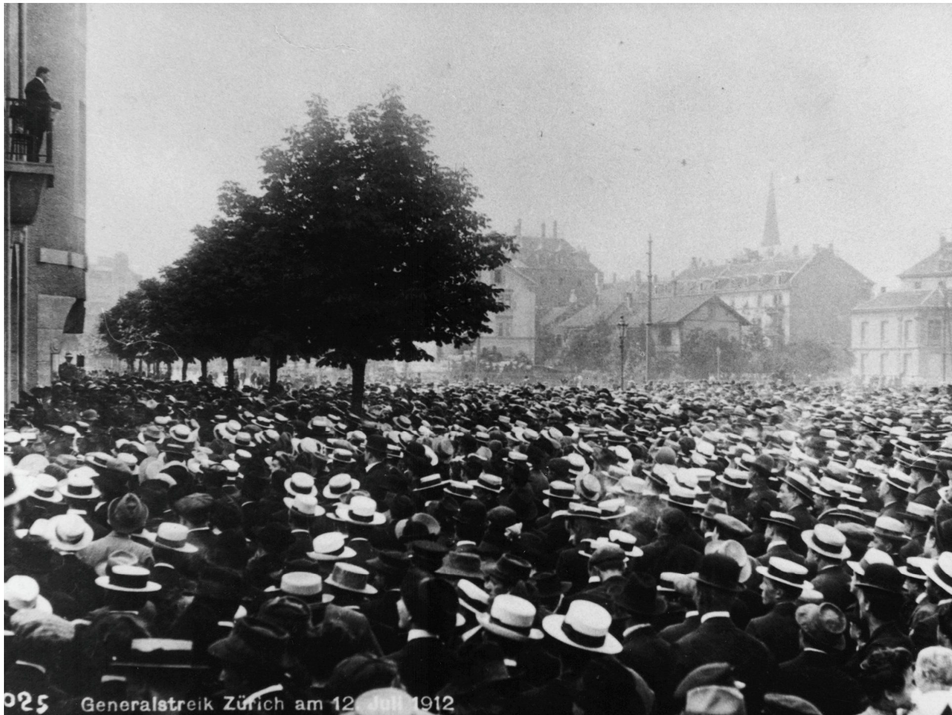
025 Generalstreik Zürich am 12. Juli 1912